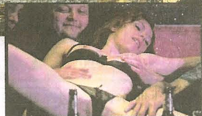
Als Nutte in einem Nachtclub lässt sich „Lucy“ von mehreren Männern betriedigen