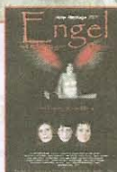
Auch auf dem Filmplakat zeigt Mönning alles